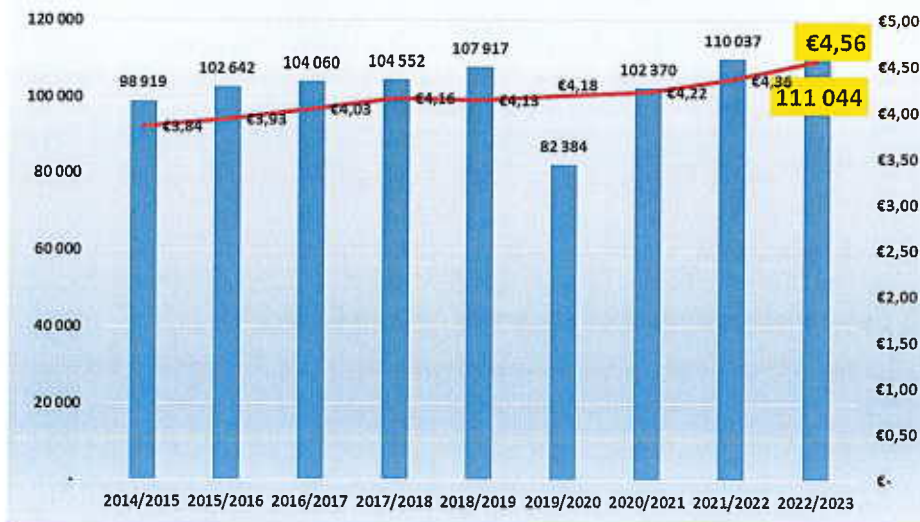
Evolution des fabrication de repas et du prix moyen facturé